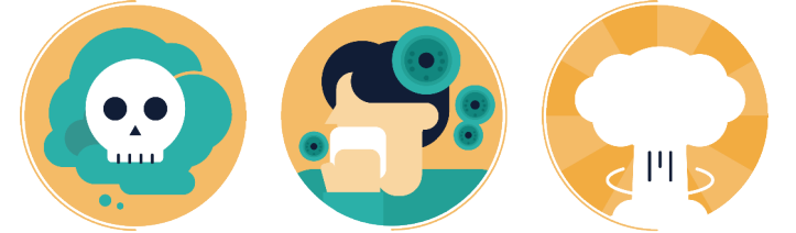
화학무기 공격시 생물학무기 공격시 핵무기 공격시

방독면 또는 마스크 등 착용 후, 고지대나 고층건물 실내로 대피 오염물질 및 환자와는 접촉 금지, 방독면 또는 마스크를 착용 후 신속히 대피 신속히 지하 대피소 또는 지하시설로 대피 출입문, 창문, 환풍기는 접착테이프 등으로 밀폐 정부 안내에 따라 감염여부 확인 및 예방접종 등 치료 핵폭발 섬광을 느끼면 폭발 반대방향으로 엎드려, 눈과 귀를 모두 막고 입을 벌림 오염된 신체부위는 비누, 세제로 흐르는 물에 15분 이상 씻고, 오염된 옷은 비닐봉지에 밀봉 음식과 물은 끓여서 섭취하며 몸과 생활공간의 청결 유지 핵폭발 이후 방사능 낙진 지역에서 대피하고 비닐, 우의 등으로 신체 노출을 최소화